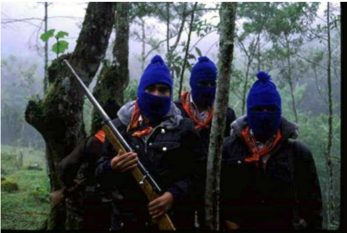
El texto del pie de foto dice: “Un grupo de milicianos armados resguardo el bloqueo_ER”